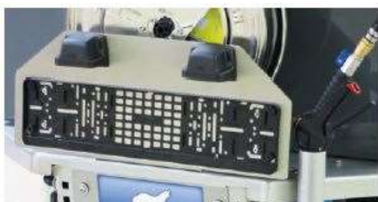
„Držiak EČV s osvetlením