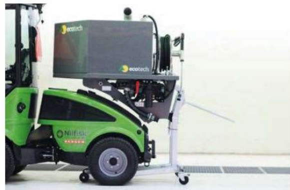
Samostatný stojan pre rýchlu výmenu do 1 minúty pre dlhodobé uskladnenie