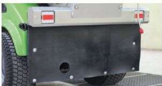
Zadný gumový chránič