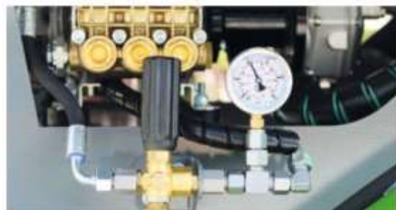
Manometer s manuálnym ovládaním tlaku