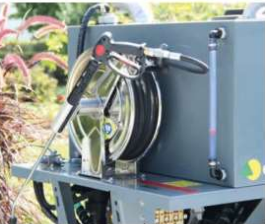
Nerezový samonavijací bubon s 15 m vysokotlakovou hadicou, umývacou pištoľou a optickou kontrolou hladiny